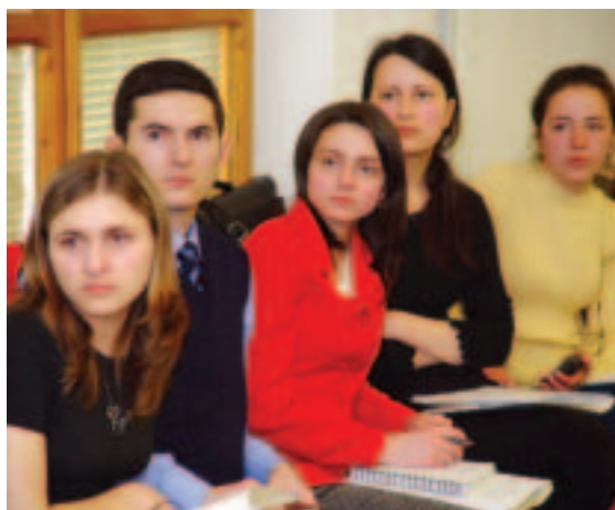
Jóvenes moldovos participan en una discusión sobre políticas con funcionarios del Banco (abril de 2005, Chisinau)

En 2005, el Grupo sobre el género y el desarrollo realizó tres seminarios mediante videoconferencia con especialistas y activistas en cuestiones de género en la India, la República de Corea, Japón, Italia, Suiza, Afganistán, China y Jordania para examinar la forma en que la tecnología de la información y las comunicaciones ha contribuido a aumentar las oportunidades económicas para las mujeres. Entre