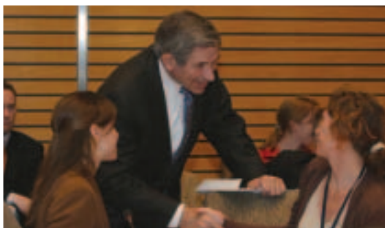
El presidente Wolfowitz saluda a representantes de las OSC durante un encuentro celebrado en el marco de las Reuniones Anuales (septiembre de 2005, ciudad de Washington)