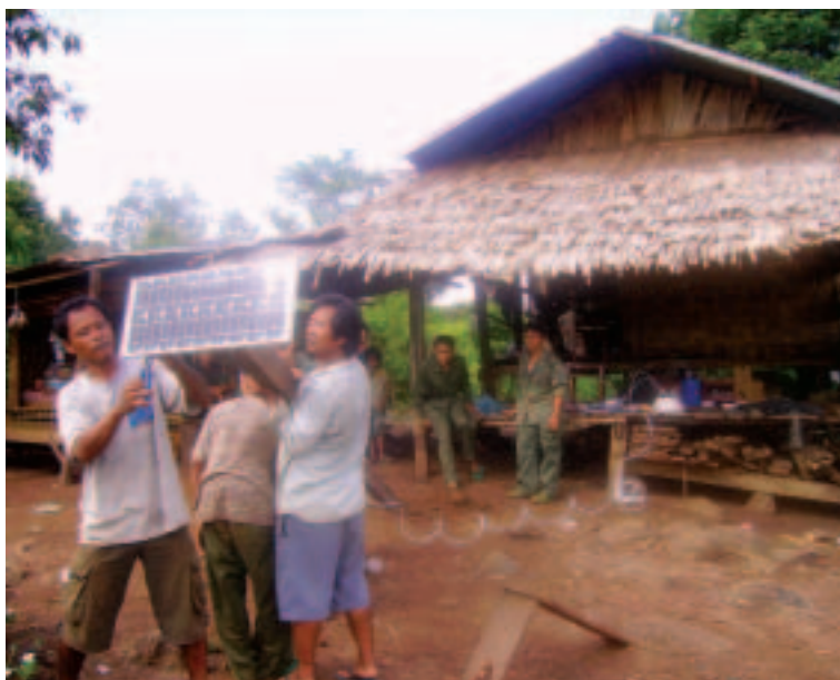
Iniciativa financiada por la Feria del Desarrollo para generar electricidad de bajo costo a partir de la energía solar (2005, República Democrática Popular Lao)

Gracias a esta participación, los lugareños afectados pudieron hacer llegar más fácilmente sus quejas e inquietudes a la Secretaría de la División, con la consiguiente mejora en la accesibilidad del gobierno y reducción del tiempo de respuesta.