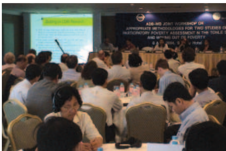
Taller conjunto del Banco Mundial, el Banco Asiático de Desarrollo y la sociedad civil acerca el estudio participativo de evaluación de la pobreza en Camboya (agosto de 2004, Phnom Penh)