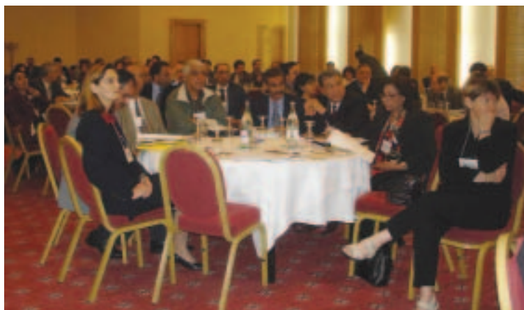
Debate entre las partes interesadas sobre la reforma de las políticas durante la Mesa redonda sobre el Magreb (mayo de 2005, Túnez)