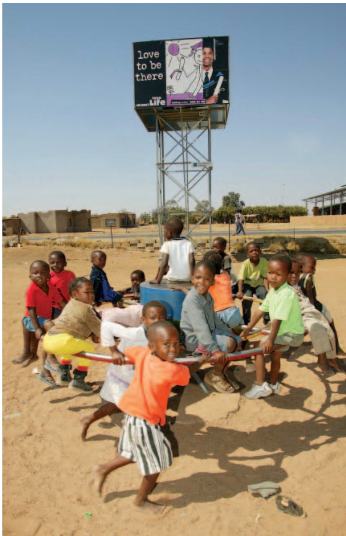
Carrusel financiado por la Feria del Desarrollo, que sirve además para bombear agua a un depósito de almacenamiento (2005, Sudáfrica)