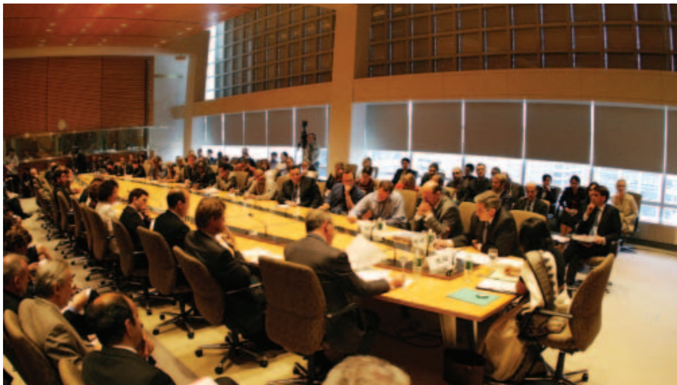
Los líderes del Banco y el Fondo dialogan con representantes de las OSC durante un encuentro celebrado en el marco de las Reuniones Anuales (septiembre de 2005, ciudad de Washington)