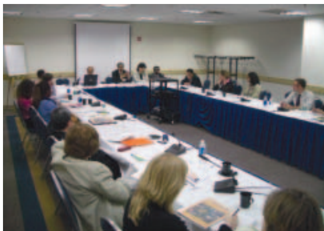
Sesión de trabajo en grupo sobre los documentos de estrategia de lucha contra la pobreza en el Foro sobre política global (abril de 2005, ciudad de Washington)

Durante el almuerzo que ofreció el segundo día, el presidente Wolfensohn reflexionó acerca de sus 10 años de mandato en el Banco. Señaló que, a pesar de las tensiones y las campañas en torno a determinadas cuestiones y proyectos, las relaciones entre la institución y las OSC no sólo habían crecido en forma exponencial, sino que también se habían forjado alianzas y programas comunes en esferas tales como educación, prevención del SIDA y protección ambiental. A continuación, algunos representantes de las OSC entregaron al Sr. Wolfensohn un comunicado en el que solicitaban reformas de políticas tanto específicas (tales como mayor participación de la sociedad civil, medidas más enérgicas para luchar contra la corrupción) como generales (por ejemplo, cancelación de la deuda, mayor asistencia para el desarrollo y un sistema comercial libre y justo). En el sitio del Banco referido a la sociedad civil se puede consultar el informe final sobre el foro, redactado por un consultor independiente, el documento del JFC, la respuesta del Banco al comunicado y otras informaciones ( www.worldbank.org/civilsociety ).