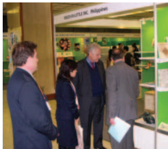
Directivos del Banco Mundial visitan la Feria del Comercio Justo durante la Conferencia Ministerial de la OMC (diciembre de 2005, Hong Kong)

sidente Wolfensohn sobre las Reuniones Anuales de 2004 y las Reuniones de Primavera de 2005, que se centraron en cuestiones actuales del desarrollo como el comercio, la deuda, la reducción de la pobreza, y el VIH/SIDA.