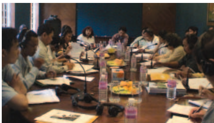
OSC camboyanas debaten la estrategia de asistencia al país con representantes de la administración del Banco (2004, Phnom Penh)

contexto de la ELP permite a las OSC y a los gobiernos interactuar de forma tal que se reconocen las limitaciones que enfrenta cada sector y a la vez se pone de manifiesto que, para lograr el desarrollo equitativo y sostenible, es necesario colaborar.