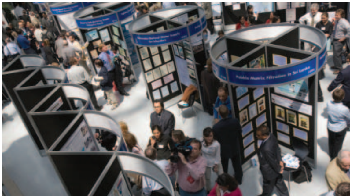
Exposición de las OSC durante el concurso mundial de la Feria del Desarrollo (mayo de 2006, ciudad de Washington)