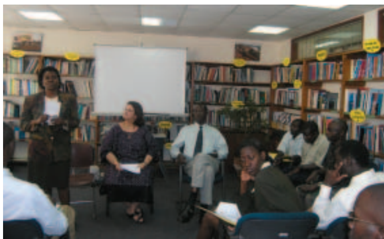
Jóvenes ugandeses se reúnen con directivos del Banco en el centro de información pública (abril de 2005, Kampala)

general y divulgarla activamente, estos servicios estimulan la participación pública en el diálogo y ayudan a los ciudadanos a tomar decisiones informadas sobre aquellas cuestiones que afectan a sus vidas. El año pasado, alrededor de 248.000 personas utilizaron los servicios de los PIC, y se espera que esta cifra aumente de año en año conforme los centros vayan ampliando sus actividades de divulgación. Existen PIC en 96 capitales del mundo. El personal ayuda a los usuarios a encontrar la información, responde a las consultas del público y atiende a sus inquietudes, y organiza seminarios, diálogos, programas de televisión por Internet y programas de radio en los que se tratan temas relativos al desarrollo. En los países con acceso limitado a Internet, el Banco, en alianza con instituciones locales, ha establecido más de 90 centros de información por satélite y 15 centros de información sobre el desarrollo. Estos centros, gestionados conjuntamente con otros organismos donantes, organizaciones de la sociedad civil, instituciones académicas y organismos públicos, posibilitan a los ciudadanos de los países en desarrollo el acceso y el intercambio de información importante sobre el desarrollo internacional. (Véase www.worldbank.org/publicinformation ).