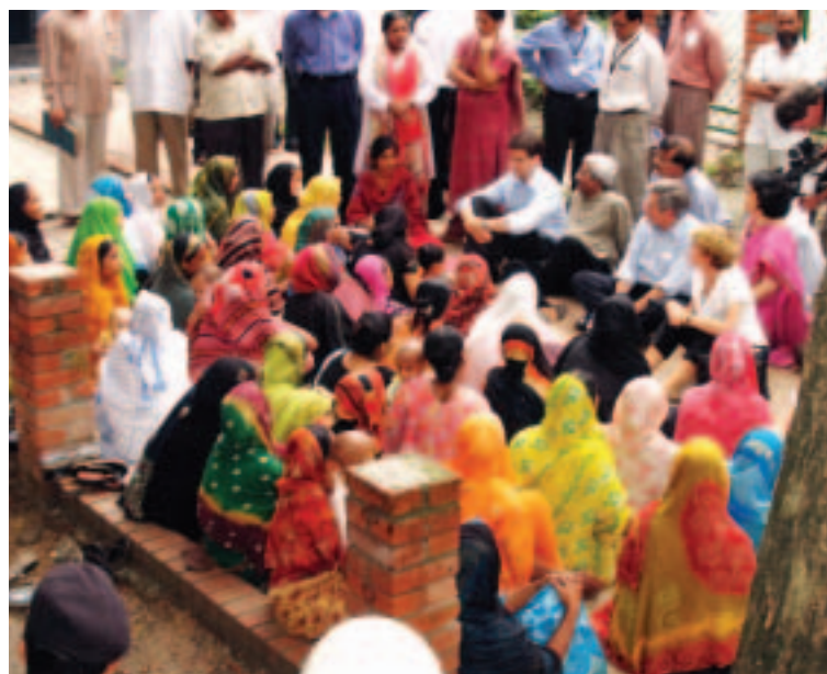
El presidente Wolfowitz se reúne con un grupo de mujeres del programa de microcréditos a los poblados durante una visita a Bangladesh (agosto de 2005, Dhaka)

En Bangladesh, el Banco facilitó la participación de la sociedad civil en la preparación del DELP, que fue presentado al Directorio Ejecutivo en 2006. Además, la Oficina de Dhaka organizó consultas en alianza con organizaciones de pueblos indígenas para la difusión de la política de operaciones revisada (OP 4.10) sobre los pueblos indígenas. En alianza con BRAC, una de las mayores ONG del