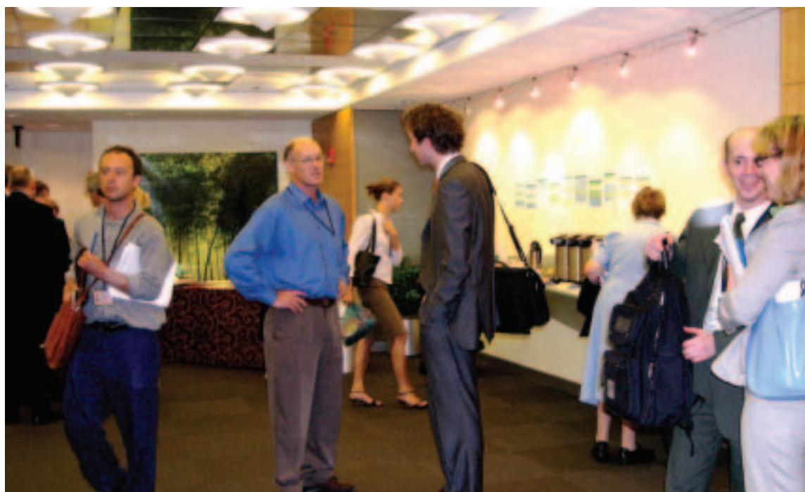
Los representantes de las OSC intercambian opiniones durante las Reuniones Anuales (septiembre de 2005, ciudad de Washington)

consultas a través de la Web (para información sobre esos procesos, véanse los Anexos I y II). Con respecto a la EAP, en un examen se señaló que se habían realizado consultas con la sociedad civil para 50 (o el 73%) de los 68 documentos de asistencia a los países aprobados en 2005 y 2006. En otro estudio se estableció que la sociedad civil había intervenido en la mayoría de las ELP, aunque el alcance y la intensidad de esta participación habían variado de un país a otro. El Banco, además, intensificó la labor que realiza a fin de promover la participación ciudadana para exigir que los gobernantes rindan cuentas de los resultados logrados. En materia de “responsabilidad social”, se respaldó el uso de prácticas de participación en el proceso presupuestario y fichas de calificación de los ciudadanos, y en varios países en desarrollo se ayudó a los gobiernos a fortalecer las condiciones propicias para la participación cívica.