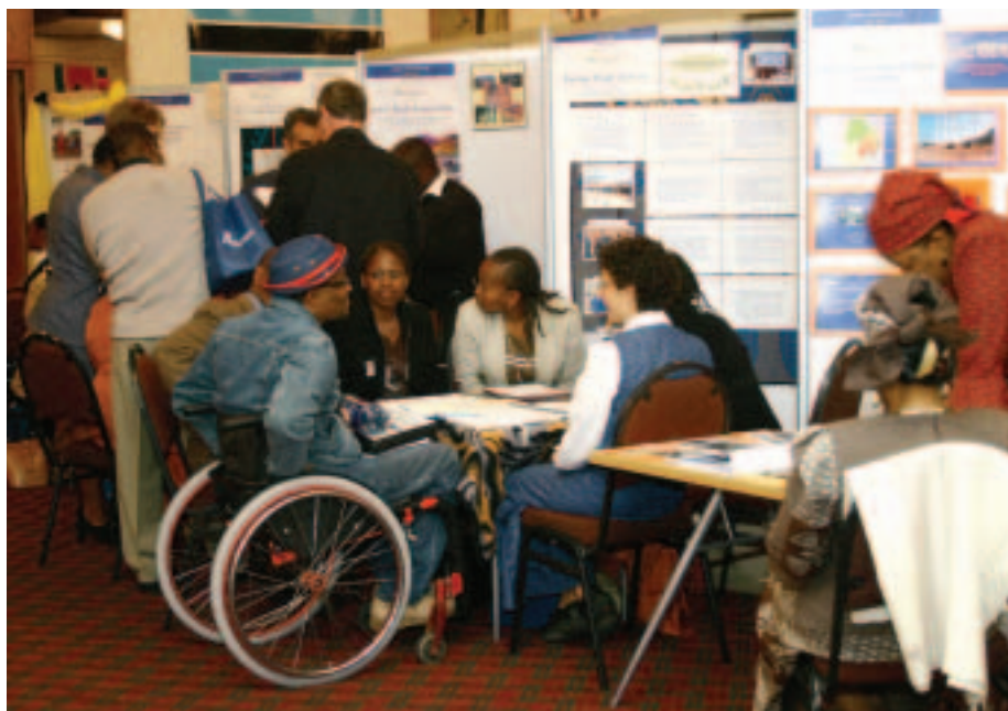
Exposición durante el concurso de la Feria del Desarrollo de África meridional (abril de 2005, Zambia)

sidades, administraciones locales y empresas implicadas en el desarrollo comunitario. La Feria propiamente dicha dura por lo general varios días y, además de los kioscos expositivos con los proyectos finalistas, incluye programas culturales que atraen a miles de participantes. Hasta la fecha, a través de las Ferias Nacionales del Desarrollo se han adjudicado más de US$13 millones entre más de 750 propuestas ganadoras de cerca de 50 países. En 2005 se celebraron Ferias Nacionales del Desarrollo en Argentina, Chile, Georgia, Ghana, Indonesia, Líbano, Malawi, México, Nepal, Paraguay, Rwanda, Turquía, Uruguay, Viet Nam, Zambia y Zimbabwe. En 2006 hubo Ferias Nacionales del Desarrollo en Albania, Bosnia y Herzegovina, China, la ex República Yugoslava de Macedonia, Filipinas, Guatemala, Kosovo, Líbano, Pakistán, Papua Nueva Guinea, Perú, República Dominicana, Serbia y Montenegro, y Viet Nam.