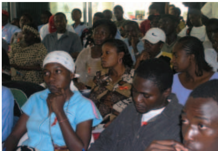
Jóvenes participan en un debate de grupo durante el Día de la Juventud de Camerún (abril de 2005, Yaundé)

coordinación con la sociedad civil, repartidos por más de 30 países. La naturaleza y el alcance de las actividades que se realizan —desde el diálogo y las consultas sobre políticas hasta la colaboración operativa— varían para cada país en función de su contexto. No obstante, todas comparten una estrategia de fortalecimiento de la sociedad civil y mejora de su capacidad para establecer alianzas con sus gobiernos y exigirles que rindan cuentas y practiquen una