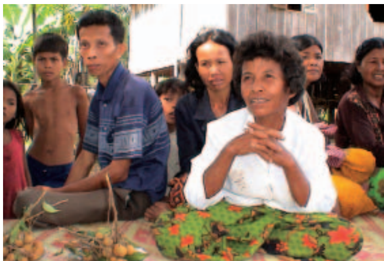
Miembros de una asociación comunitaria participan en un programa de capacitación en derechos humanos y cuestiones de género financiado por el Banco Mundial (2004, Camboya)