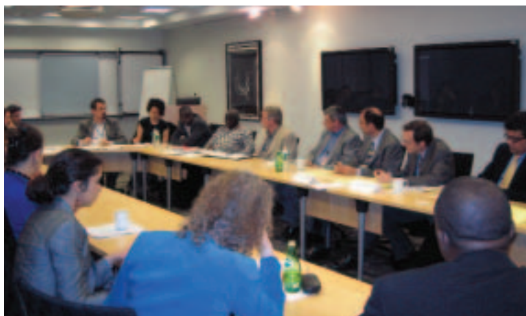
Representantes de las OSC y personal del Banco debaten las políticas sobre industrias extractivas durante las Reuniones de Primavera (abril de 2006, ciudad de Washington)

sobre sus proyectos y divulgó información sobre su trabajo. La actividad más importante fue el amplio proceso de consultas para la puesta al día de los criterios de rendimiento social y ambiental de la institución, conocidos anteriormente como las políticas de salvaguardia, y de su política de acceso a la información. A través de este proceso, la CFI escuchó a una amplia variedad de partes interesadas de todo el mundo y tomó en consideración sus puntos de vista, incorporándolos a las políticas definitivas en la medida de lo posible.