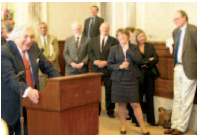
Reunión de despedida ofrecida por representantes de la sociedad civil al presidente Wolfensohn (mayo de 2005, ciudad de Washington)

tas de la lucha contra el SIDA y grupos de jóvenes. Mantuvo numerosas reuniones con organizaciones y también ofició de anfitrión en una reunión abierta, en recepciones y diálogos mediante videoconferencia para escuchar a grupos de la sociedad civil de todo el mundo. Además, en los principales discursos que pronunció durante el primer año de su presidencia, en repetidas oportunidades el Sr. Wolfowitz hizo hincapié en el papel fundamental que juega la sociedad civil en la tarea de brindar servicios a los pobres y exigir a los gobiernos y a las instituciones internacionales como el Banco que rindan cuentas a los ciudadanos. También abogó por una mayor colaboración entre el Banco y la sociedad civil, y considera que el fortalecimiento de la sociedad civil y de otras instituciones para la rendición de cuentas es un factor importante en su esfuerzo por fortalecer el apoyo del Banco a la promoción del buen gobierno y la lucha contra la corrupción.