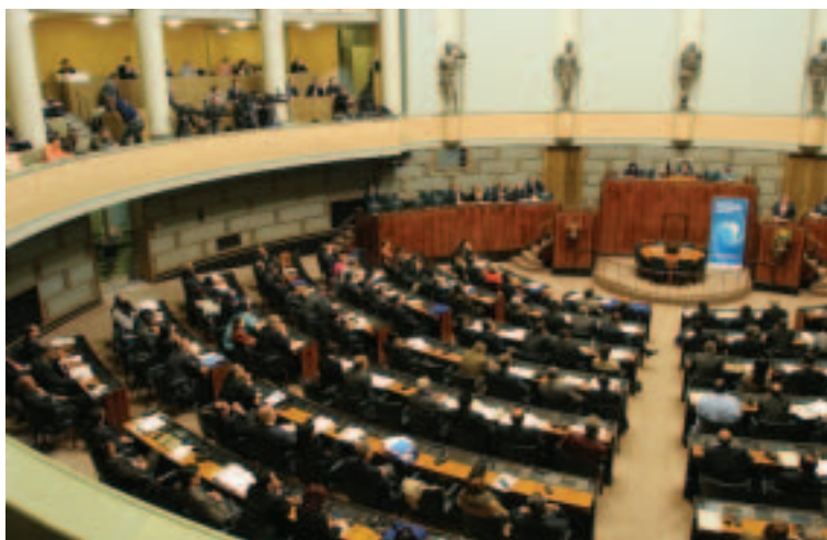
Conferencia anual de la Red Parlamentaria sobre el Banco Mundial (octubre de 2005, Helsinki)