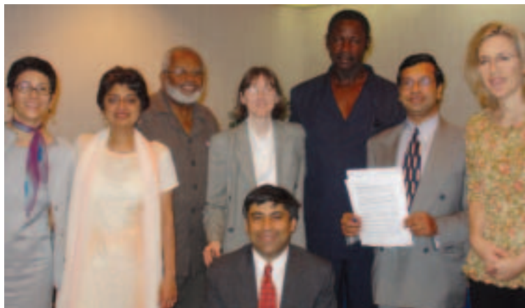
Personal del Banco Mundial se reúne con líderes sindicales durante la cumbre sobre políticas del Caribe (febrero de 2006, Trinidad y Tabago)