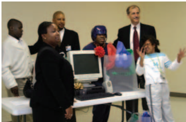
Personal del Banco Mundial en el acto de donación de computadoras a una entidad sin fines de lucro en la ciudad de Washington (2005)

A lo largo de 2005 y 2006, el Programa de extensión comunitaria del Banco siguió prestando asistencia a la población de bajos ingresos de la ciudad de Washington. El programa alienta al personal del Banco, cuyo trabajo diario se centra en la promoción del desarrollo económico y la lucha contra la pobreza en los países en desarrollo, a manifestar también su