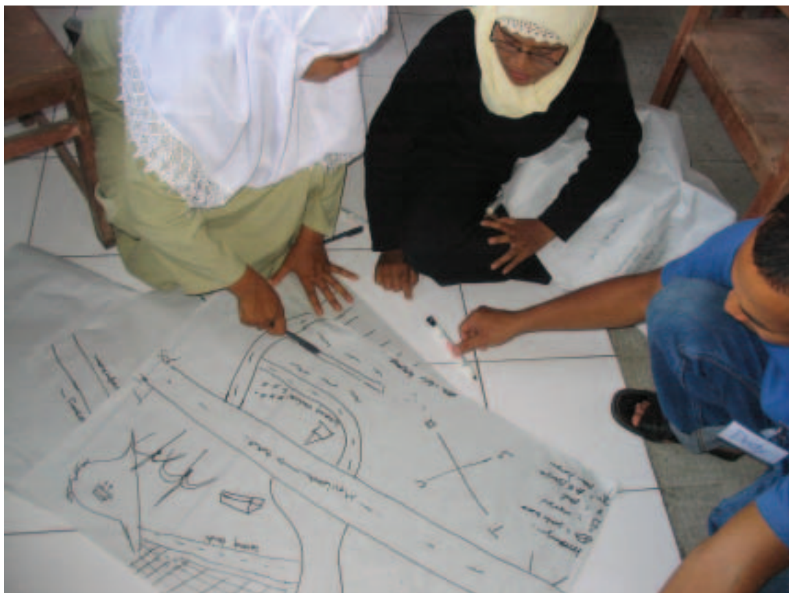
Residentes afectados por el tsunami examinan mapas de su comunidad en un proyecto de reconstrucción financiado por el Banco Mundial (2005, Indonesia)

medios de subsistencia con la garantía de sus viviendas.