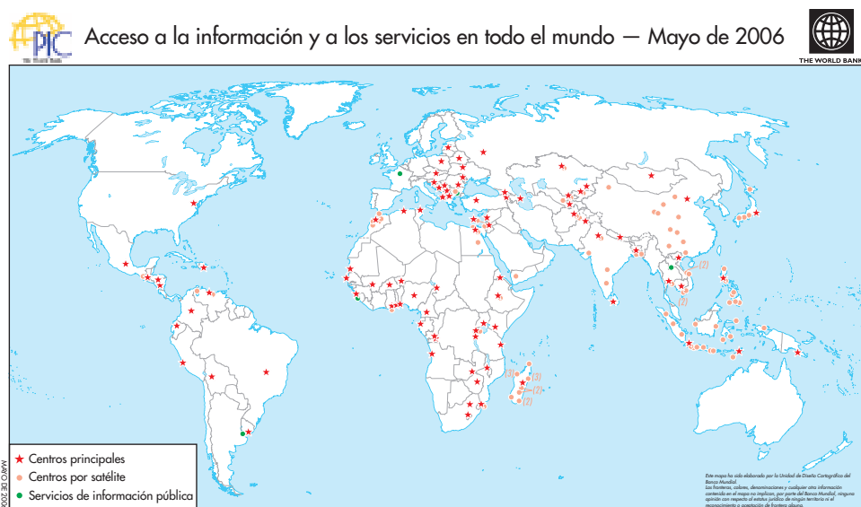
Ubicación de los centros de información pública en todo el mundo (junio de 2006)

Youthink! es el recurso en línea del Banco para estudiantes, adolescentes y niños. Redactado en un lenguaje adecuado para esas edades, aborda las cuestiones relativas al desarrollo explorando los temas que preocupan e interesan a los jóvenes. Invita