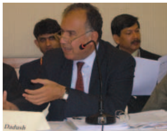
Representantes del Banco y las OSC debaten sobre la política comercial durante la Reunión ministerial de la OMC (diciembre de 2005, Hong Kong)