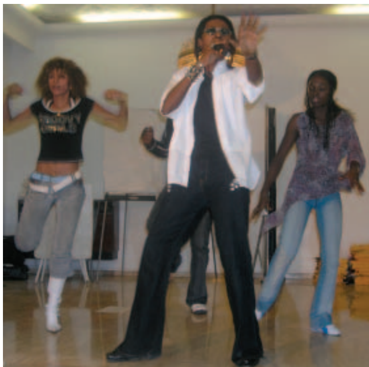
Actuación de un grupo de rap durante el Día de la Juventud de Camerún (abril de 2005, Yaundé)