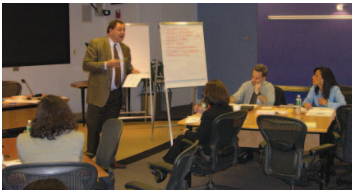
Curso de capacitación sobre consultas con las partes interesadas para personal del Banco y de las OSC (mayo de 2005, ciudad de Washington)

Socorro en casos de desastre. El personal del Banco se moviliza espontáneamente para dar res-