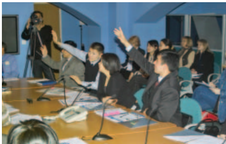
Jóvenes dan a conocer sus opiniones sobre el desarrollo a funcionarios del Banco (abril de 2005, República Kirguisa)

Otra importante iniciativa llevada a cabo el año pasado fue el establecimiento de la Red "Youth, Development and Peace" (YDP) en marzo de 2005. La red se creó como resultado de reuniones y consultas realizadas con importantes organizaciones juveniles de todo el mundo tales como el Foro Europeo de la Juventud, la Confederación Internacional de Organizaciones Sindicales Libres (CIOSL), el Movimiento Internacional de Estudiantes Católicos y la Organización Mundial del Movimiento Scout. Por ejemplo, una conferencia celebrada en Sarajevo (Bosnia y Herzegovina) en octubre de 2004, congregó a dirigentes juveniles de 83 países y a directivos superiores del Banco, entre ellos el presidente Wolfensohn, para estudiar maneras de mejorar las relaciones entre el Banco y los jóvenes. La misión de la Red YDP consistirá en facilitar el diálogo, la interacción y la labor conjunta entre las organizaciones de jóvenes y el Banco conjuntamente con otros agentes del desarrollo que se ocupan de la reducción de la pobreza y de problemas de desarrollo. En marzo de 2005, el Banco organizó reuniones de participación general para jóvenes en forma simultánea en 60 oficinas de países con el fin de estudiar la mejor forma de promover la colaboración entre el Banco y la juventud a nivel local.