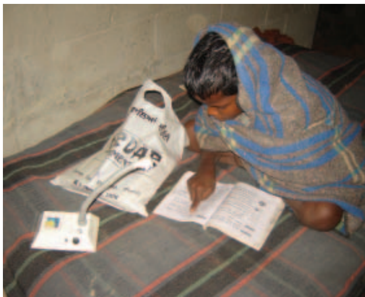
El alumbrado mediante energía solar —una iniciativa de la Feria del Desarrollo— posibilita la lectura nocturna (2005, Nepal)

En Sri Lanka, el compromiso con la sociedad civil se materializó fundamentalmente a través del Programa de Pequeñas Donaciones. En 2006, seis organizaciones seleccionadas recibieron financiamiento de este programa para fortalecimiento de la capacidad, desarrollo de conocimientos prácticos, formación de dirigentes y creación de equipos de trabajo, bajo el lema Desarrollo de la juventud . El Banco distribuyó US$35.000 para financiar actividades de