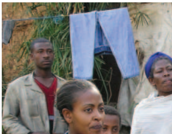
Visita sobre el terreno realizada por la PNoWB a un proyecto sobre el SIDA en Etiopía (enero de 2004)

Los últimos dos ejercicios han confirmado sin duda que en las relaciones entre el Banco y la sociedad civil hay una tendencia creciente hacia un diálogo sobre políticas más sustantivo a nivel mundial y hacia una mayor colaboración operacional a nivel de país. No sólo se está produciendo un diálogo más horizontal y abierto sobre las cuestiones de política más complejas y difíciles, como el financiamiento en apoyo de las reformas de política, durante las Reuniones Anuales y de Primavera, sino que actualmente ese diálogo se lleva a cabo mediante videoconferencias habituales, conferencias telefónicas e Internet. A nivel de país, donde esas relaciones tienen las mejores perspectivas y se están intensificando con más rapidez, el criterio participativo adoptado para formular la EAP y para diseñar y aplicar la ELP está abriendo un espacio de política sin precedentes para las relaciones entre el gobierno y la sociedad civil. A nivel operacional, la ampliación de los fondos sociales mediante experiencias tan innovadoras como el financiamiento para combatir el SIDA en África y la reconstrucción después del tsunami en Asia está demostrando, en la práctica, que la sociedad civil y los gobiernos pueden ser asociados complementarios en el proceso de desarrollo.