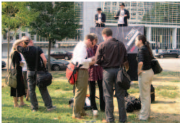
Teatro al aire libre organizado por OSC para abogar por el alivio de la deuda durante las Reuniones Anuales (septiembre de 2005, ciudad de Washington)

Durante los últimos dos años, el grupo del Banco dedicado a la deuda mantuvo una serie de diálogos sobre políticas con OSC a fin de aclarar la posición del Banco y conocer la opinión de las OSC acerca de la IADM y de otras cuestiones relacionadas con la deuda. Durante las Reuniones Anuales de