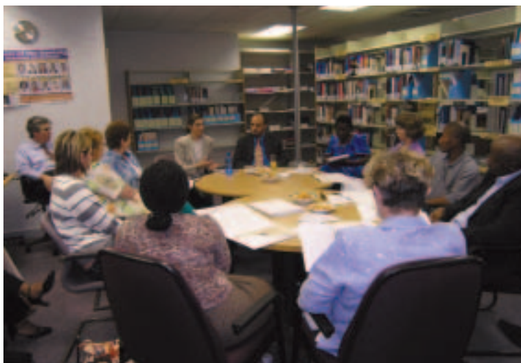
Reunión de consulta acerca del Informe sobre el desarrollo mundial 2006: Equidad y desarrollo (noviembre de 2005, Sudáfrica)

OSC. El surgimiento de OSC en el hemisferio norte con una posición enérgica y crítica de las políticas y los proyectos del Banco fue uno de los motivos de la escasa participación del Banco en los sectores de energía, transporte, desarrollo urbano y abastecimiento de agua y saneamiento desde mediados de la década de 1990. El financiamiento para proyectos de inversión en infraestructura proporcionado por el Banco decreció aproximadamente un 50% entre 1993 y 2003 debido a las inquietudes por el impacto social y ambiental no deseado que podrían generar proyectos de infraestructura de gran magnitud. En 2003, el Banco elaboró un Plan de acción para la infraestructura en respuesta a la creciente demanda de los países en desarrollo de financiamiento para ese sector. El plan tiene como objetivo incrementar la cartera de proyectos de infraestructura mediante la asistencia financiera y asesoría en materia de políticas y la profundización de los conocimientos de los países en esa esfera.