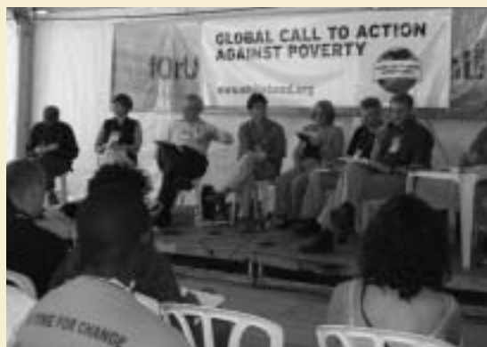
Miembros del personal del Banco participan de un debate sobre globalización durante el Foro Social Mundial (enero de 2005, Brasil)

El Foro es el acontecimiento internacional dedicado a la socie-