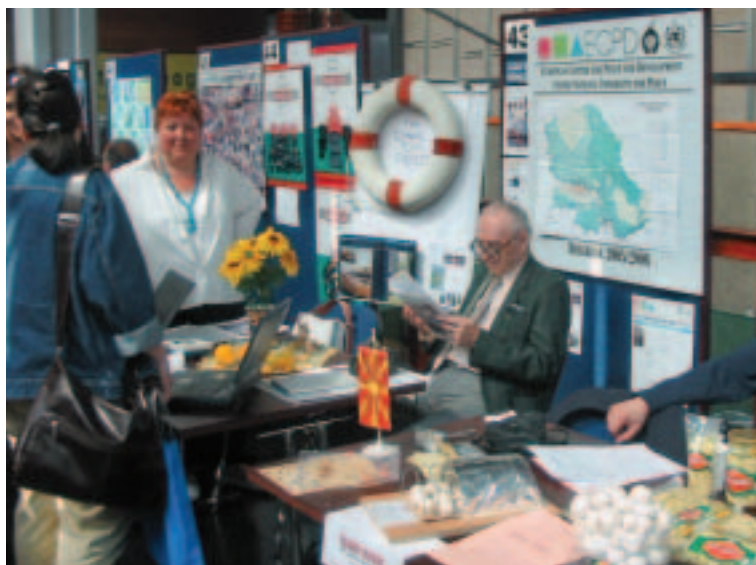
Exposición de las OSC durante el concurso de la Feria Regional del Desarrollo de los Balcanes (mayo de 2006, Serbia)

y enfoques existentes para implicar a las comunidades locales en la adopción de decisiones en el plano municipal. Las conclusiones fueron utilizadas por una OSC local, People's Voice Project, para mejorar el acceso a la administración local, y también se están utilizando en un proyecto sobre audiencias presupuestarias financiado por la Eurasia Foundation. Además, el equipo de la Oficina del Banco en Albania completó en diciembre de 2004 una encuesta de valoración por los clientes que se repartió entre las partes interesadas del país, incluidos representantes de las OSC. Los resultados de la encuesta indican una creciente apreciación del Banco en Albania y una aprobación general de las prioridades de financiamiento del Banco y de la eficacia en la prestación de apoyo.