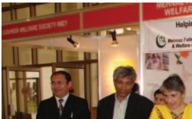
Apoyo a personas discapacitadas en Pakistán a través de la Feria del Desarrollo (marzo de 2006, Islamabad)

Las oficinas del Banco también continuaron aplicando y ampliando el programa Voces de la Juventud en más de 20 países; el programa alienta a los jóvenes a familiarizarse más a fondo con la labor del Banco a través del diálogo sobre políticas, la participación en el diseño de proyectos, el fortalecimiento de las capacidades y mediante iniciativas de promoción a cargo de los jóvenes. Por ejemplo, en el Brasil, el diálogo entablado en el marco del programa Voces de la Juventud ha sido fundamental para el establecimiento de un consejo nacional de la juventud y una secretaría nacional de la juventud. En Moldova, los jóvenes organizaron una caravana de la juventud, cuyo objeto era establecer contacto con los jóvenes de las comunidades rurales.