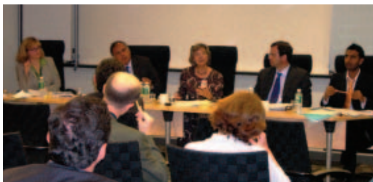
Panel compuesto por representantes de las OSC, el Banco y el Fondo discute cuestiones relacionadas con el comercio durante las Reuniones de Primavera (abril de 2006, ciudad de Washington)

En ese trabajo se exponen varias conclusiones. En primer lugar, la sociedad civil es un conjunto muy diverso, y las relaciones del Banco con las OSC son multifacéticas y complejas y varían según el sector o el grupo de que se trate. En segundo lugar, las OSC se han multiplicado en forma exponencial desde comienzos del decenio de 1990 y han asumido un rol preponderante en la formulación de políticas y el financiamiento para el desarrollo: abogan con éxito por causas como el alivio de la deuda, el aumento de la ayuda y las salvaguardias sociales y ambientales. En tercer lugar, el Banco ha aprendido de la experiencia que la participación de la sociedad civil es importante para la eficacia en términos de desarrollo y la reducción de la pobreza, puesto que a menudo las OSC pueden brindar servicios a los pobres de un modo más eficaz que los gobiernos.