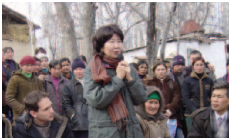
Funcionaria del gobierno informa a los pobladores acerca de las prioridades de financiamiento del fondo para el desarrollo comunitario (República Kirguisa)

grupos académicos y asociaciones profesionales. La nota sobre la estrategia provisional de la República Bolivariana de Venezuela es un buen ejemplo de los resultados positivos que generan las consultas en sociedades productoras de petróleo y polarizadas en las que el Banco juega un papel relativamente pequeño. El proceso incluyó una serie de talleres en cinco ciudades en los que una gran variedad de interesados utilizó una metodología novedosa orientada a encontrar puntos de coincidencia superando las posturas retóricas. En el caso de la EAP de la India, se realizaron consultas con varios niveles del gobierno, la sociedad civil, los círculos académicos, los medios de comunicación y el sector privado. Por otro lado, se espera que la ejecución de la EAP para Ucrania, tal como se señala en el informe de situación de 2005, se beneficie de la participación de la sociedad civil. Las modificaciones propuestas para la estrategia se discutieron con representantes del Gobierno de Ucrania y son el reflejo del debate con miembros del Verkhovna Rada (Parlamento) y representantes de empresas, organizaciones cívicas, grupos de estudio, ONG y asociados para el desarrollo.