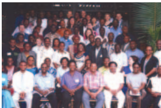
Taller de capacitación sobre responsabilidad social dirigido a múltiples partes interesadas en África (mayo de 2005, Ghana)

Como parte de su programa sobre responsabilidad social, el Banco ha seguido apoyando la participación de la sociedad civil en los procesos de examen y gestión del presupuesto de muchos países en desarrollo. Las experiencias varían: desde la intervención de las OSC en la presupuestación participativa y en procesos de análisis presupuestario hasta iniciativas referidas a tarjetas de calificación para los ciudadanos. La tarea del Banco en esta esfera incluyó la realización de una investigación propia sobre las prácticas presupuestarias locales, la capacitación de OSC en colaboración con otras organizaciones y las donaciones destinadas a financiar las iniciativas de seguimiento presupuestario por parte de la sociedad civil. En la India, por ejemplo, el Banco apoya a Public Affairs Foundation, una ONG de Bangalore que realiza el seguimiento de la calidad de los servicios gubernamentales (véase el Recuadro 15 de la página 54). En Brasil, el Banco realiza un estudio de la iniciativa de presupuestación participativa de