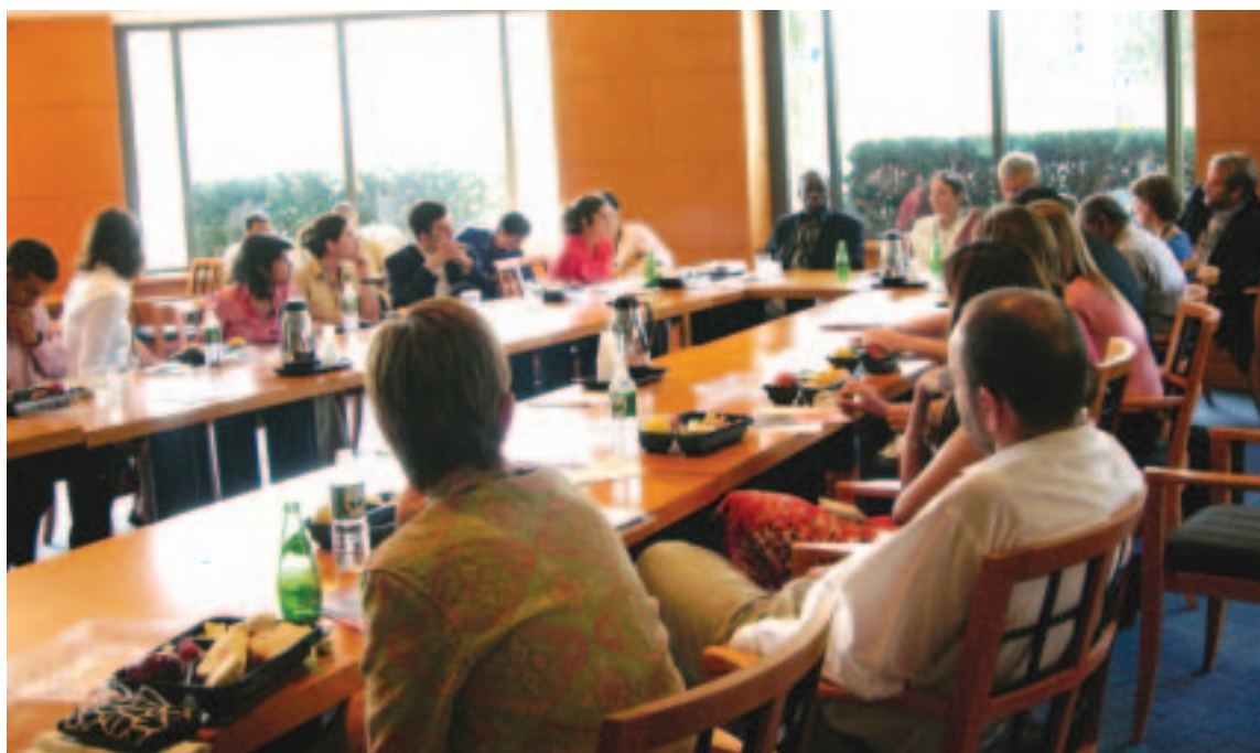
Consultas sobre la estrategia de desarrollo social (septiembre de 2006, ciudad de Washington)