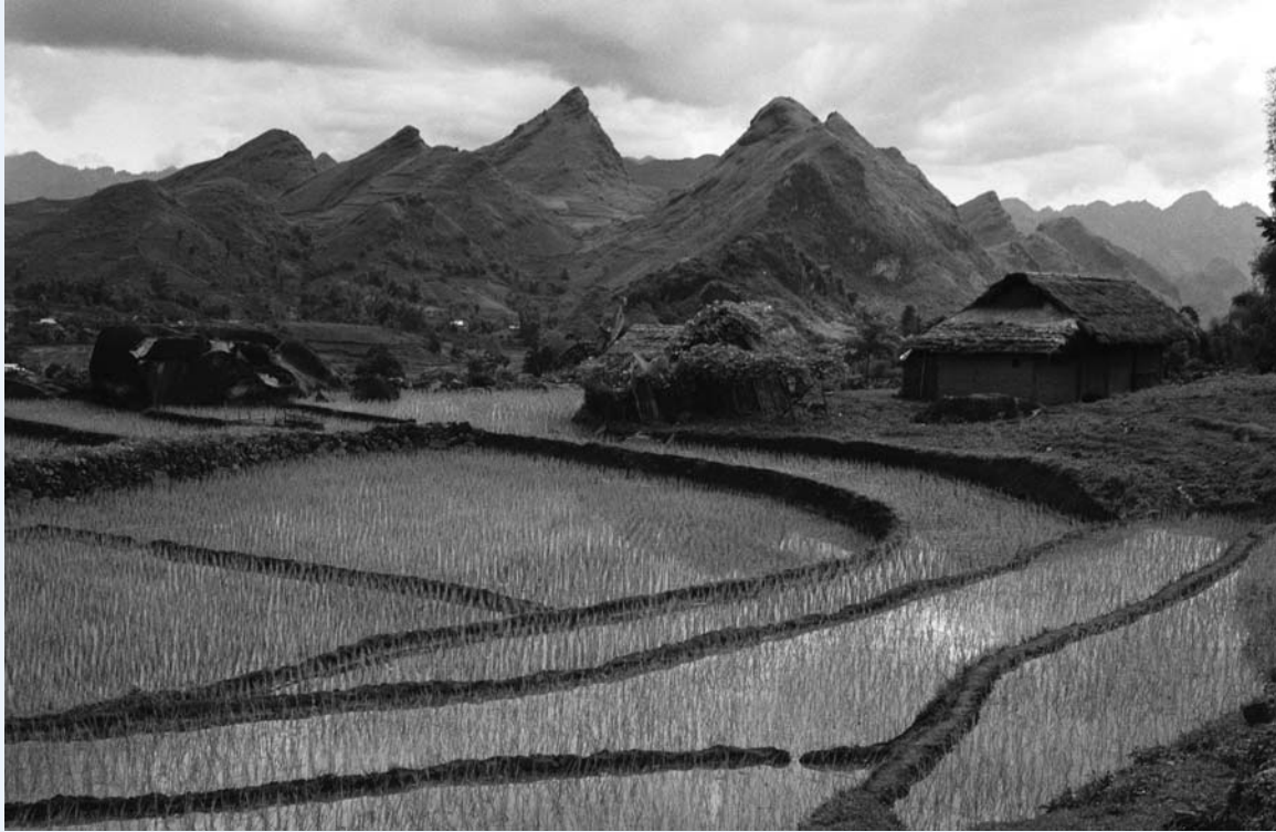
Arrozales en terrazas cerca de una aldea de la minoría Red Zao, a las afueras de Sapa, provincia de Lao Cai, en el norte de Viet Nam.