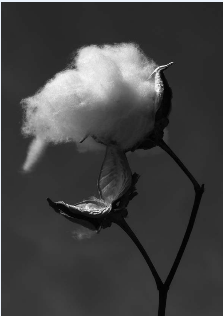
Planta de algodón, Abu Asher, Sudán.