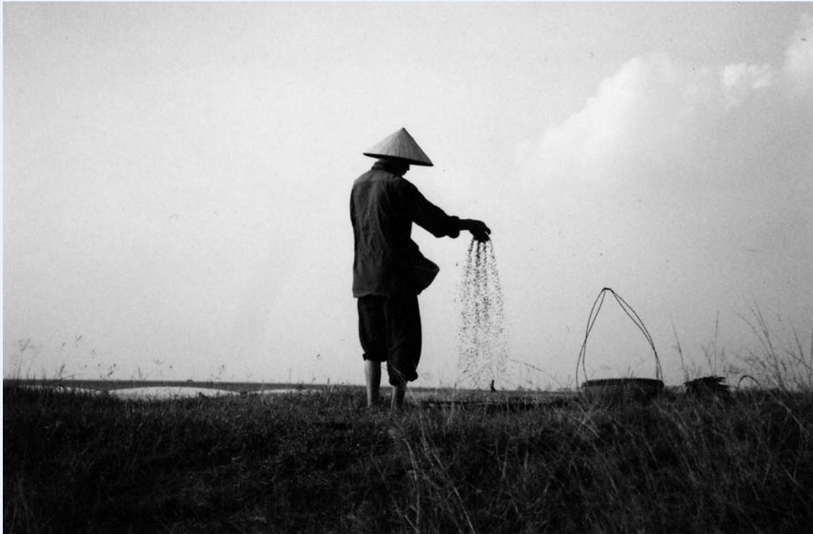
Un hombre tamiza semillas en un campo junto al Río Rojo, en el norte de Viet Nam.