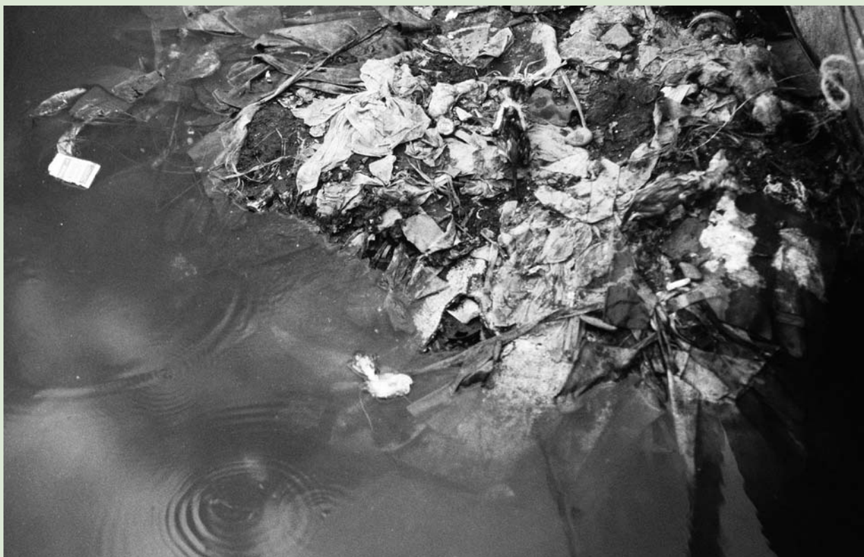
Загрязнение воды на Филиппинах.