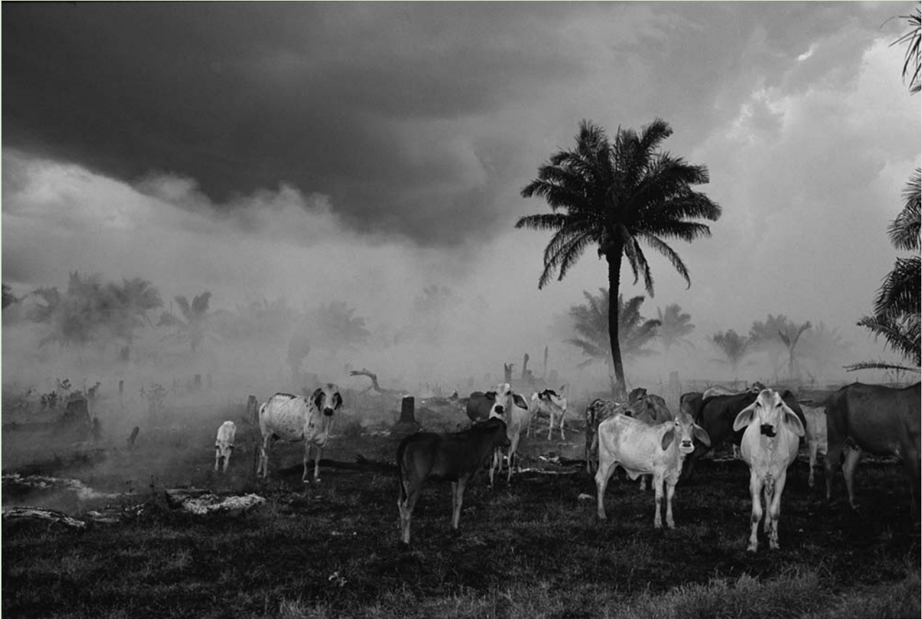
Выжженные дождевые леса Амазонии, недавно расчищенные под пастбища.