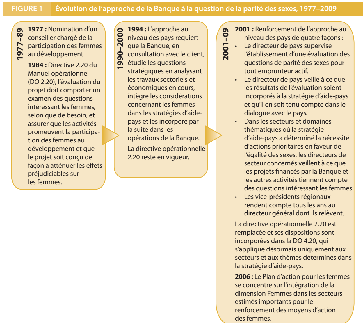
FIGURE 1 Évolution de l'approche de la Banque à la question de la parité des sexes, 1977–2009

En avril 2001, la Banque a renforcé l'approche au niveau des pays grâce à un document stratégique sur la dimension Femmes examiné au Conseil [ Integrating Gender into the World Bank's Work: A Strategy for Action (Intégrer la dimension Femmes dans les activités de la Banque mondiale : Stratégie d'action) ] ; Banque mondiale 2002b). Dans la Stratégie de 2001, on réaffirmait l'objectif de la Banque : aider les pays