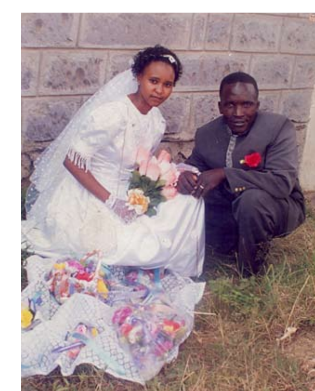
a former CSW, now married and in informal employment