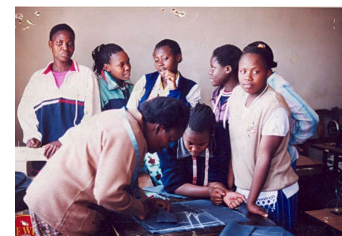
CSW being trained on dress making