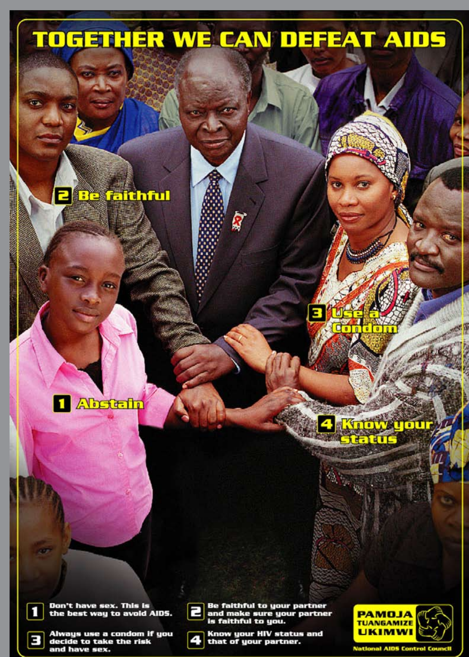
Pamoja poster with the President, Hon. Mwai Kibaki indicating highest political commitment

Beneficiaries: Diverses organisations intervenant en matière de VIH auprès des femmes et enfants Les fonds d'IWAR ont appuyé les activités du Centre de réhabilitation volontaire des femmes du Kenya (KVIWRC)