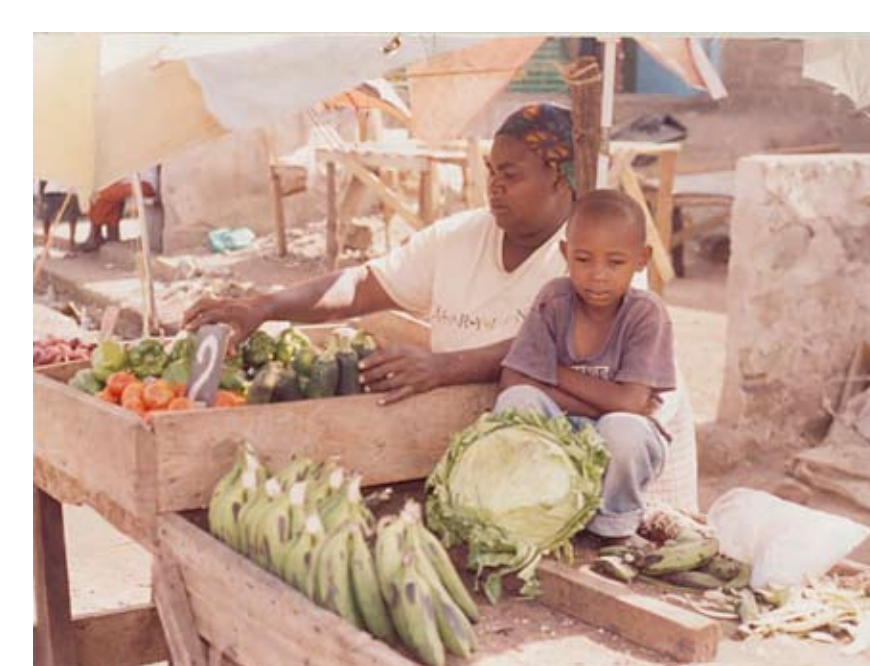
Former CSW now on small scale income generating activity