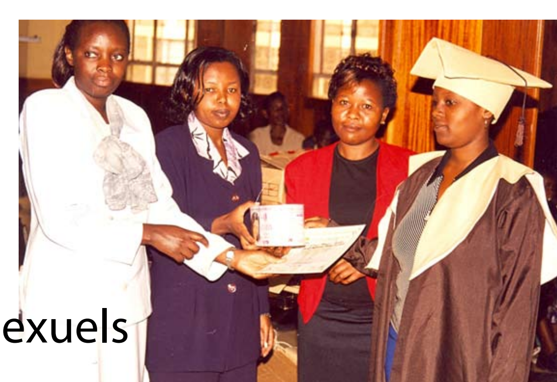
a CSW graduates with Hair dressing skills