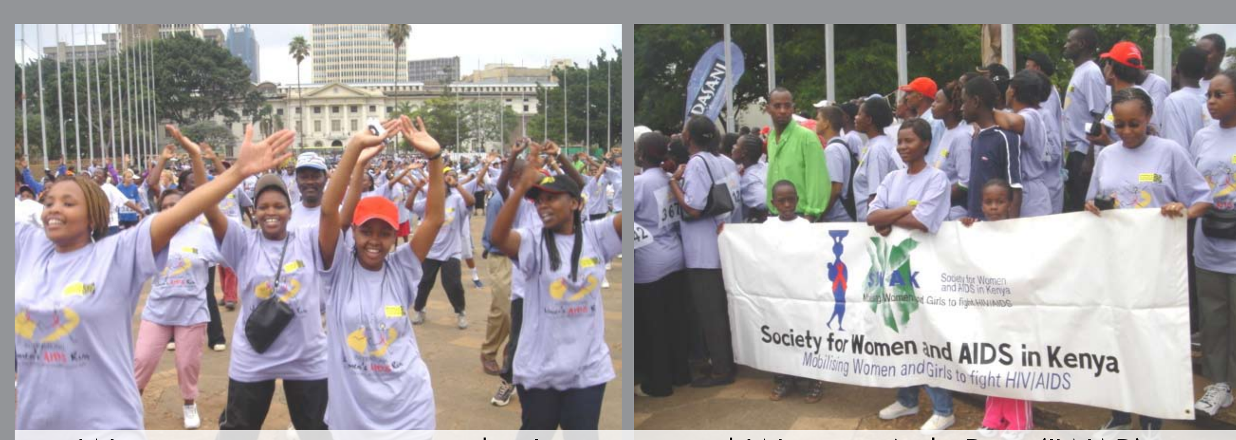
Women participating in the International Women Aids Run (IWAR)

Plaidoyer et mobilisation des ressources en vue de l'intégration de la dimension genre