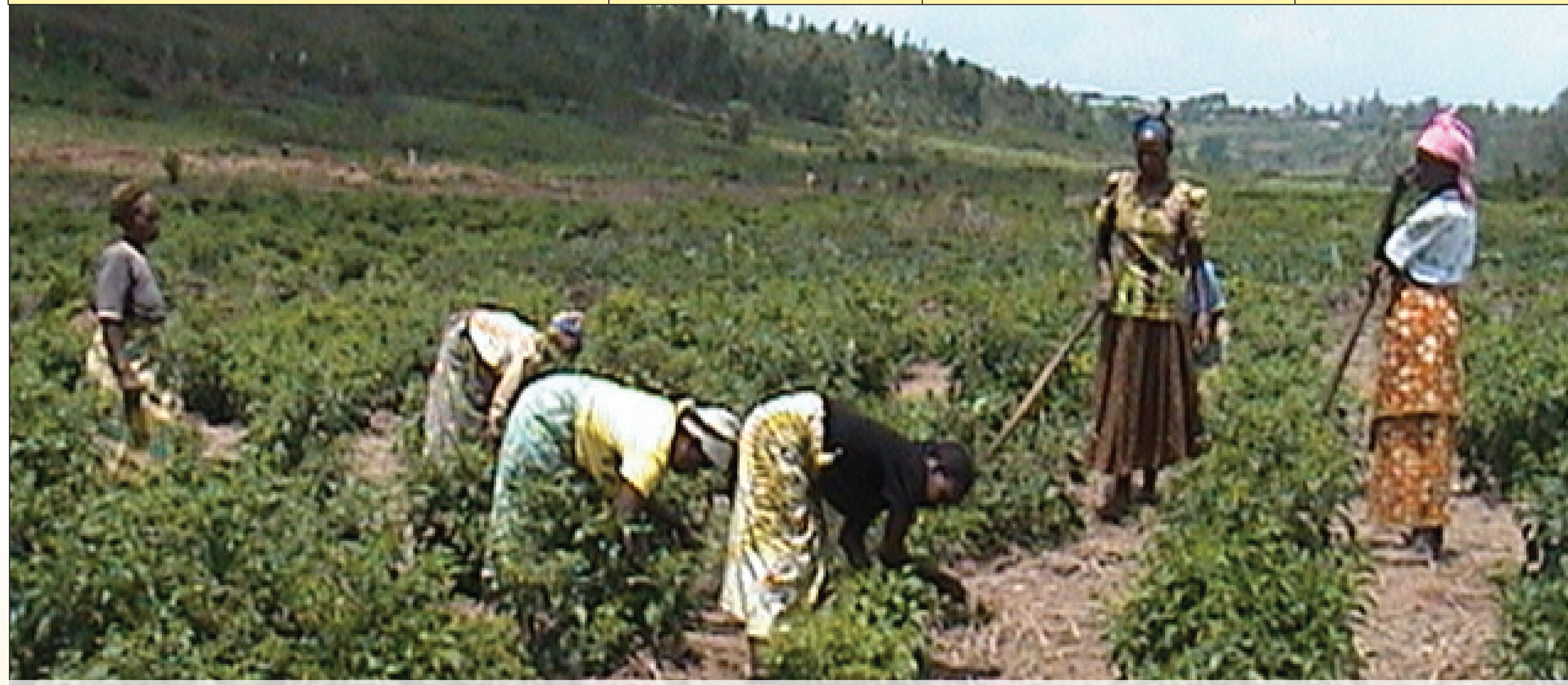
Membres de l'association triant du poivre

Le PPS Rwanda emploie un mécanisme efficace pour canaliser les fonds vers les groupes de la société civile, ceux-ci ayant reçu près de la moitié des fonds du projet. Un vaste éventail d'organisations éligibles (comme AVEGA-AGAHOZO) servent d'« agences d'encadrement », aidant les organisations plus petites à préparer les sous-projets et à obtenir des fonds PPS. L'approche participative permet aux bénéficiaires de déterminer leurs besoins et d'élaborer leurs propres activités génératrices de revenu. Les femmes bénéficient le plus de ces activités.