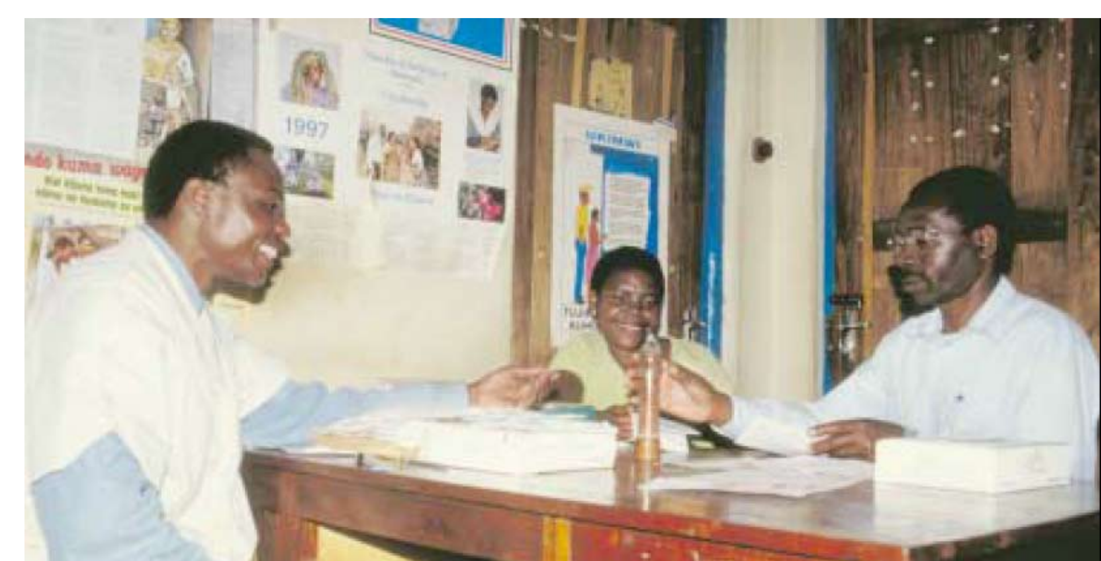
Séance de conseil de couple

Contrairement au préservatif masculin dont la demande est très élevée par rapport à l'offre, l'acquisition de préservatifs féminins a été assez faible, seuls 776.000 préservatifs ayant été distribués dans le pays en 2006. L'introduction de la commercialisation sociale des préservatifs, qui porte aussi sur les préservatifs féminins et les programmes de sensibilisation, a complété et même dépassé la distribution gratuite des préservatifs dans les structures de santé.