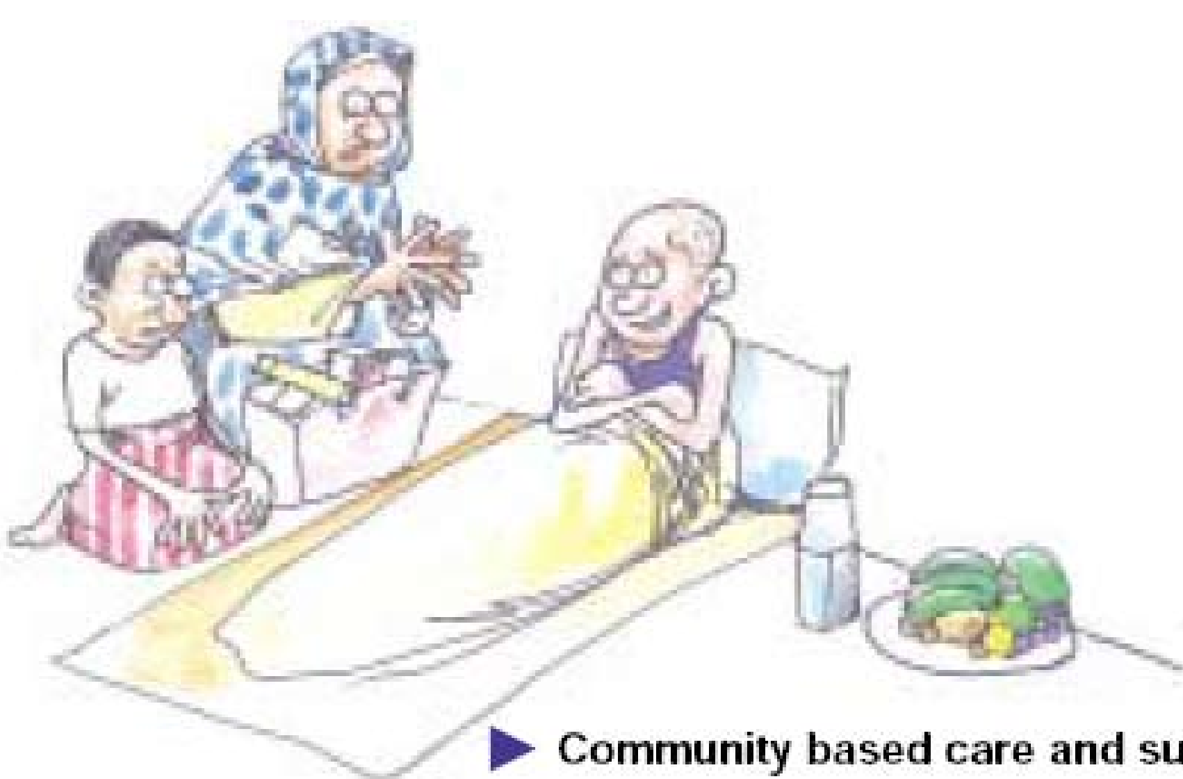
Community based care and support services

Les OSC, y compris les réseaux de PVV, ont fourni et continuent de fournir la majorité de ces services, dont le traitement des infections opportunistes, l'appui économique et social aux individus, familles et communautés affectés par le SIDA. Avec l'augmentation permanente du nombre de personnes faisant appel à ces services, le MdsAS examine de plus en plus les modalités d'un déploiement d'agents non sanitaires, surtout les femmes qui procédaient auparavant aux soins à domicile dans le cadre du lancement de ses programmes de soins à domicile.