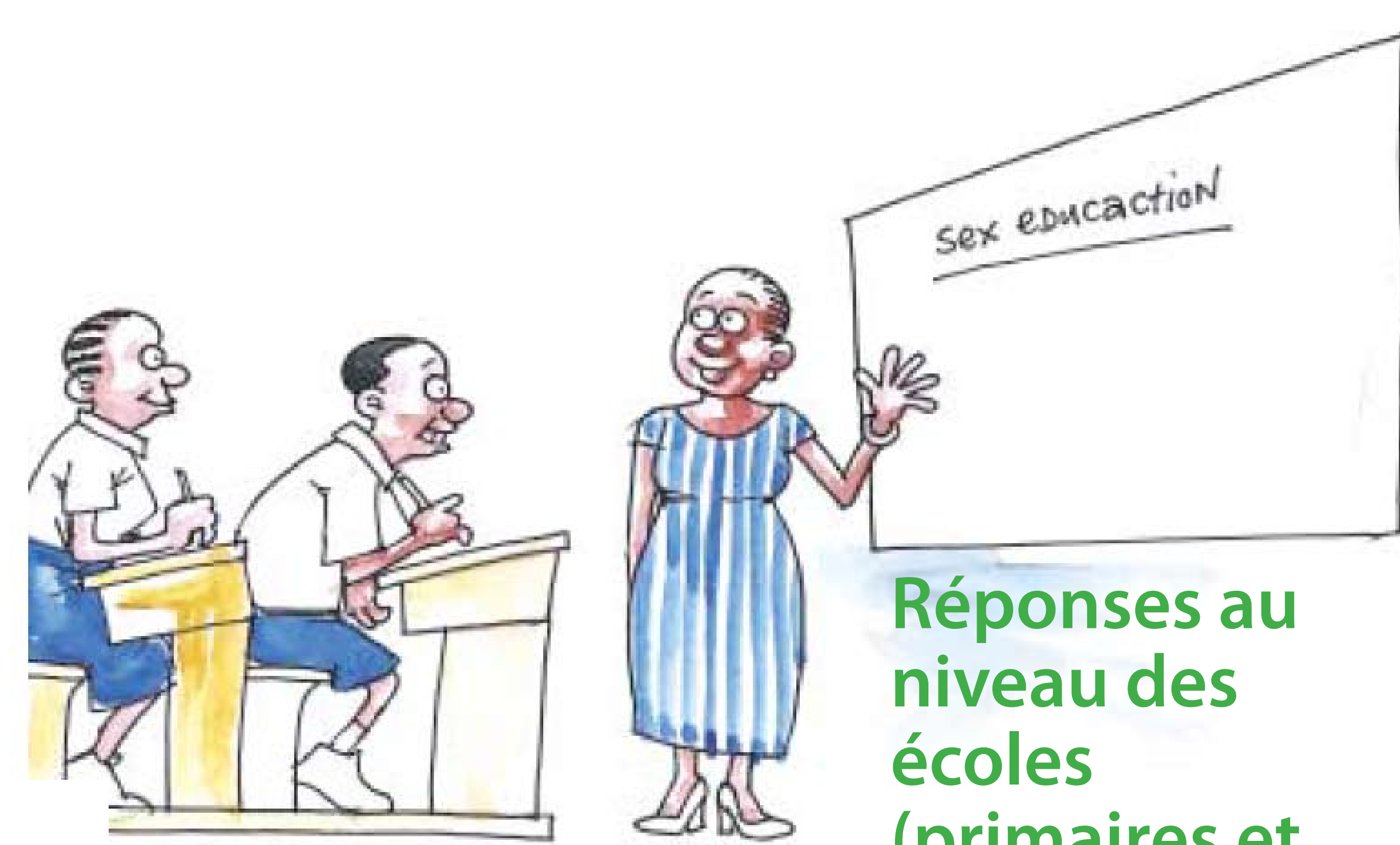
Réponses au niveau des écoles (primaires et secondaires)

Le Ministère de l'éducation et de la formation professionnelle (MDEV) a élaboré un Plan stratégique du secteur de l'éducation en matière de VIH et SIDA (2003 – 2007), ainsi que des directives pour l'exécution d'une formation exhaustive sur le VIH et la préparation à la vie active dans les écoles et les collèges d'enseignants. L'ensemble des lycées et près de 1.500 écoles primaires se trouvent à des stades différents d'exécution de la stratégie.