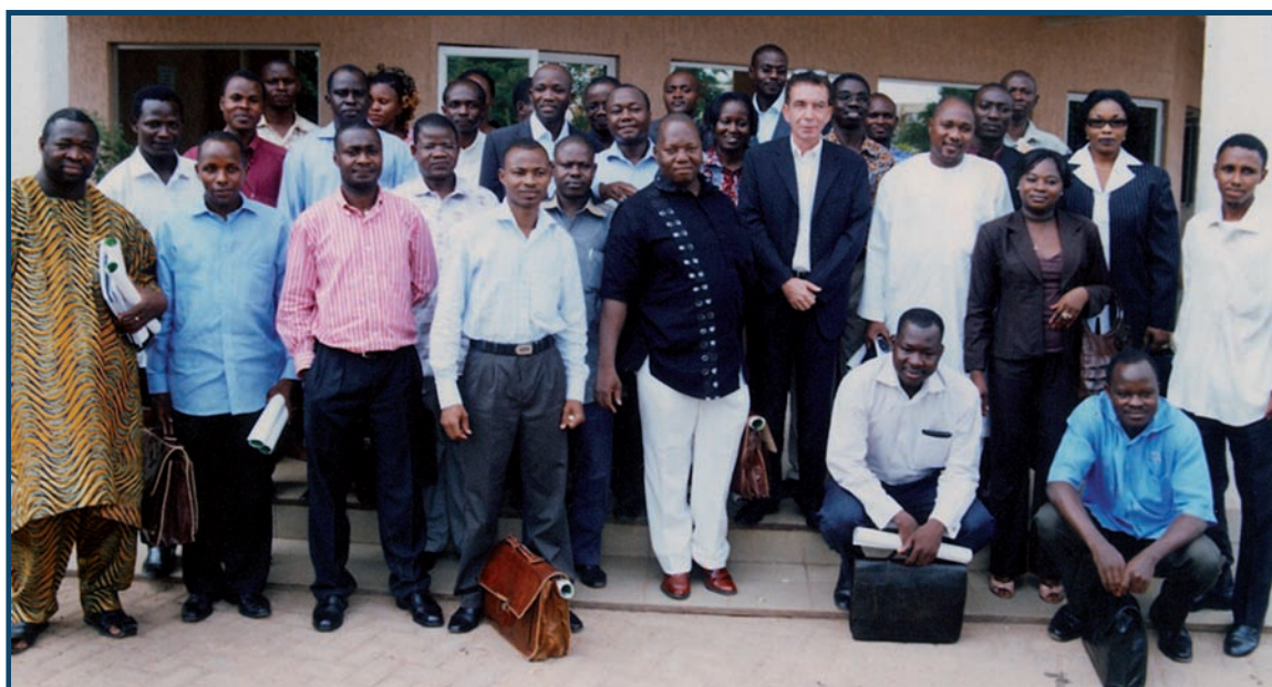
Une photo de famille des participants à l'atelier

Il a précisé que « l'exequatur désigne une procédure au cours de laquelle le juge étatique va vérifier que la sentence remplit certaines conditions de fond ».