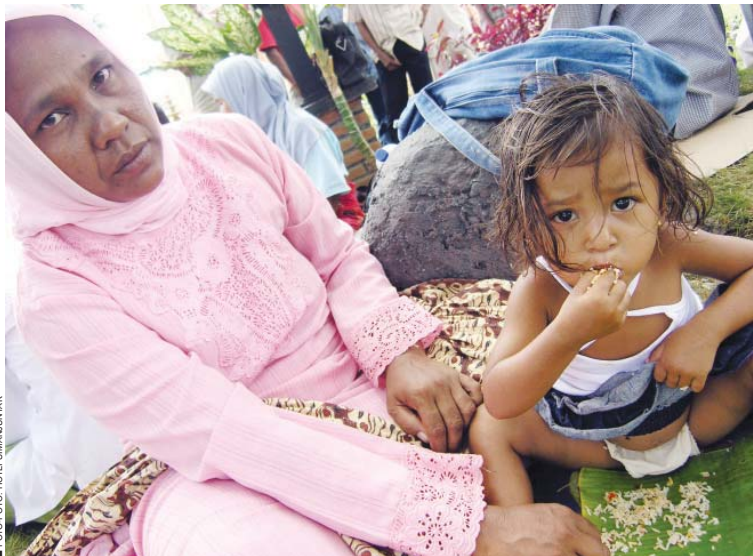
Seorang ibu korban konflik sedang menyuapi anaknya makan nasi bungkus, saat berdemonstrasi menuntut dana bagi korban konflik di kantor BRA Banda Aceh

Orang yang akibat konflik tidak dapat meneruskan mata pencaharian pokoknya seperti semula dan sampai saat ini tidak dapat membiayai hidupnya secara normal.