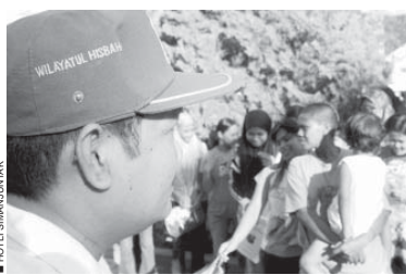
■ HOTEL SIBANGUNYAK

Syariat punya cita-cita yang agung; untuk lahirnya masyarakat