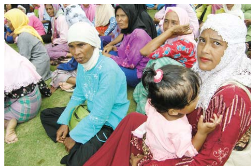
Puluhan wanita korban konflik sedang berkumpul, saat melakukan aksi demo menuntut dana bagi korban konflik di kantor BRA, Banda Aceh.