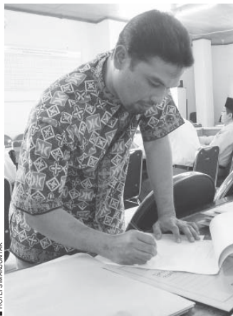
■ HOTEL SIBANGUNYAK

Sebenarnya tidak ada yang dibayar dan tidak ada yang membayar. Yang kedua ini adalah se-