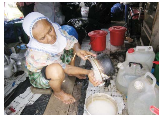
Seorang wanita penghuni tenda sedang memasak di dalam tenda yang sempit. Menjelang dua tahun proses rekonstruksi Aceh, masih banyak masalah yang mesti dibarengi oleh pelaku rekonstruksi.