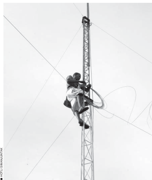
■ HOTEL SIMANJUNTAK