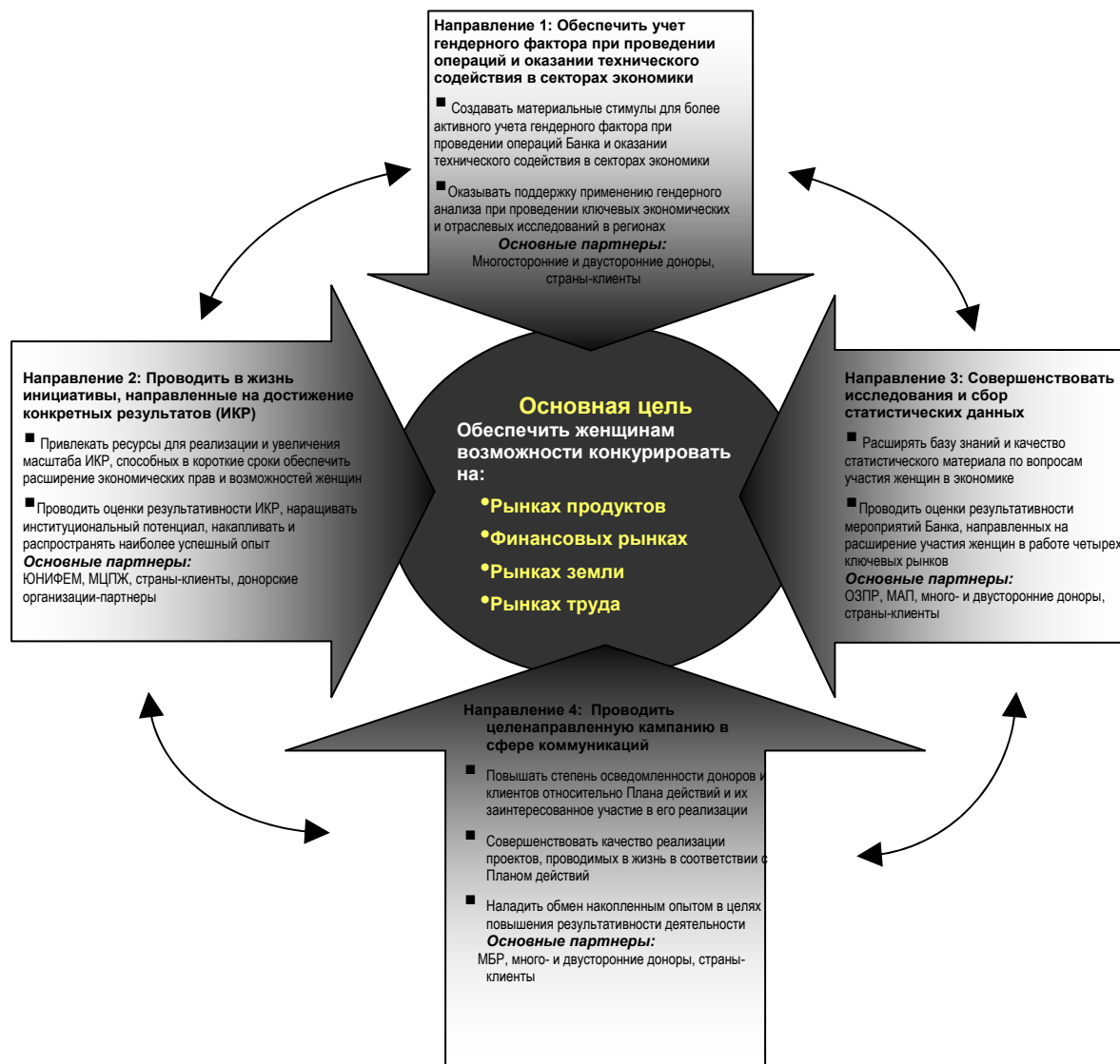
Диаграмма 2. Четыре направления деятельности для решения поставленных в Плана задач