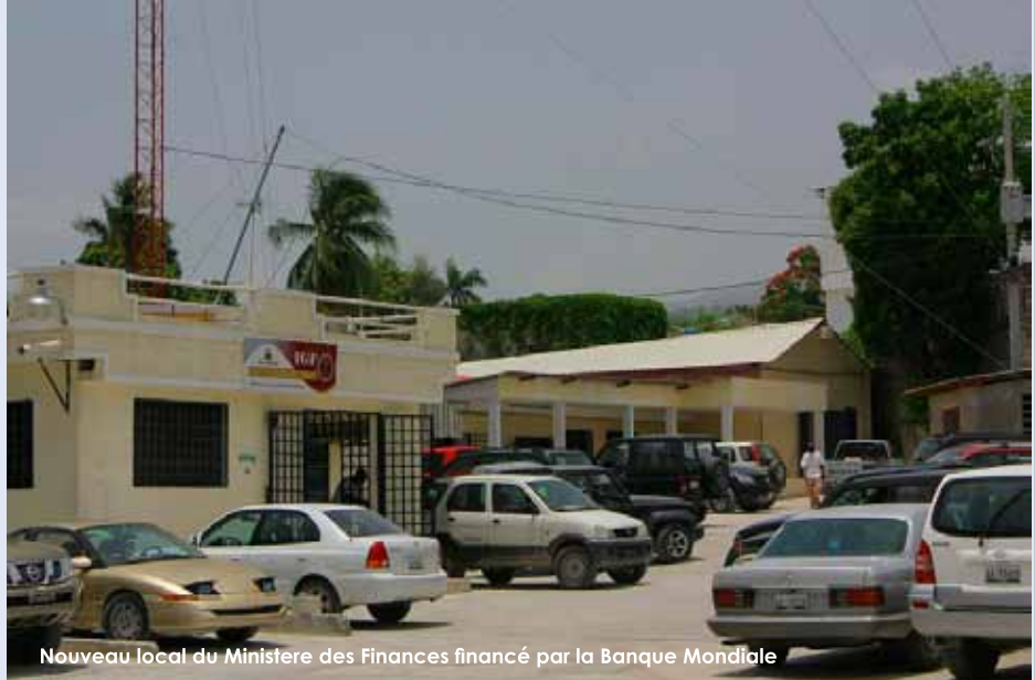
Nouveau local du Ministère des Finances financé par la Banque Mondiale

Quand j'ai pris fonction en novembre dernier j'avais commencé à négocier avec la BM un programme sur 3 ans qui visait une vaste campagne d'infrastructure de toutes sortes, Infrastructures routières, électricité système d'irrigation pour l'agriculture en s'appuyant sur des partenariats secteur public/secteur privé pour attirer massivement des investissements dans le pays et cela nous permettrait de sortir de .la période de stabilisation macroéconomique avec très peu de croissance que nous avons eu ces dernières années pour entrer dans une période toujours de stabilisation macroéconomique avec des taux de croissance de plus en plus élevés. Le tremblement de terre est venu mettre un peu de pagaille dans les perspectives a très court terme puisque cette année nous aurons un taux de croissance négative donc très faible, moins 8,5%, mais nous sommes en train de faire en sorte que cette calamité qui vient de nous frapper soit convertie en opportunité pour que dès l'année prochaine on rebondisse avec un taux de croissance très élevé voisin de 10% et aligne pendant plusieurs années des taux de croissance qui ne seront jamais inférieur à 6 %. Pour cela nous