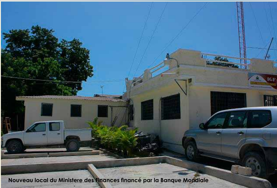
Nouveau local du Ministère des Finances financé par la Banque Mondiale

s'engagent à utiliser ces montants dans un fonds qui va servir pour faire des dons y compris à Haïti encore. De sorte que Haïti va bénéficier du propre montant d'annulation de sa dette qui est payée par d'autres partenaires. Il y a le cas de la BID, 479 millions de dollars ont été annulés et on va poursuivre avec les autres institutions internationales.