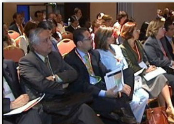
Audiencia durante la sesión

El Banco Mundial y el Banco Inter-Americano de Desarrollo están comprometidos a llevar adelante esta agenda al (1) apoyar y promover un diálogo sistemático y regular con los responsables de las ISA para definir las estrategias y prioridades de las reformas de políticas; (2) ofrecer apoyo sistemático para el desarrollo de los recursos humanos de las ISA, modernizando sus metodologías de auditoría y mejorando sus relaciones externas, comunicación y prácticas de extensión conjuntamente con otros socios para el desarrollo; (3) lanzar un emprendimiento conjunto para promover y canalizar esfuerzos que de otra manera serían demasiado pequeños para producir un impacto sistemático y resultados sostenibles, a través de interacciones innovadoras (por ejemplo, Memoranda de Entendimiento para ejercer control externo de conformidad, calidad y resultados conjuntamente) y de mayores intervenciones (al nivel Regional); y, finalmente, (4) favorecer mayor colaboración inter-institucional, aprendizaje por pares y revisiones por pares para crear una comunidad de prácticas y una red de conocimiento compartido entre los países de la región de América Latina y el Caribe y con las ISA de otras regiones del mundo.