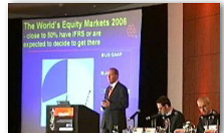
Sesión Plenaria: Contabilidad global

La fecha límite para presentar comentarios sobre la Norma Internacional de Información Financiera para PyMEs de IASB es octubre 1, 2007. Para alentar la participación de América Latina y el Caribe hemos traducido el borrador de exposición al español y al francés (disponible en www.iasb.org ). Pensamos que la NIIF para PyMEs final resultará muy adecuada para muchas pequeñas empresas de la región. Como con todas las propuestas de IASB, siempre hay espacio para mejorar y este es precisamente el objetivo de nuestro proceso de consulta pública. Por esta razón, solicitamos a las PyMEs de la región, así como también a las pequeñas firmas de auditoría, entidades que otorgan préstamos y otros que proveen capital a PyMEs que lean nuestra propuesta y nos den su opinión.