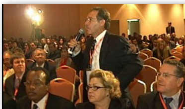
Preguntas y respuestas durante la sesión

Los auditores externos juegan un papel esencial con respecto a la exactitud y fiabilidad de la información financiera generada por las instituciones financieras. Desde 1998, de forma consistente con un enfoque aprobado por el Comité Basel de Supervisión Bancaria, el Banco Central de la República Argentina ha iniciado acciones para asegurar que los auditores externos de las instituciones financieras no solo estén correctamente calificados sino también que observen efectivamente altas normas de auditoría.