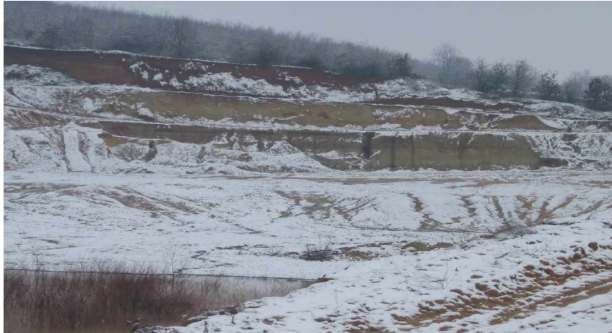
Miniera sipërfaqësore e eksploatimit të rërës kuarcore në Mirosalë

hapësirën e depozitimeve neogjene, si dhe nafta e supozuar në thellësi 1600 m. Në lindje të komunës së Ferizajt supozohen rezervat e argjilës. Afër fshatit Zllatar ekziston masa e leuciteve (mineral fosfori) si material për prodhimin e plehrave artificiale.