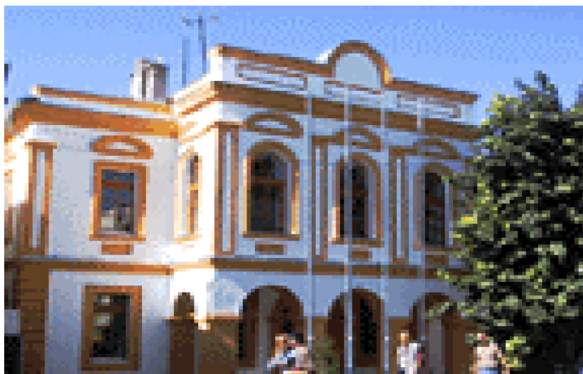
Ndërtesa e Kuvendit Komunal të Gjilanit

Përveç Grupeve Punuese, u formua edhe Forumi i Palëve të Interesuara. Anëtarë të këtij forumi ishin palë të ndryshme komunale si nga administrata, Kuvendi, biznesi, shoqëria civile, etj. Forumi kontribuoi me sugjerime dhe analiza të fazave të ndryshme hartuese strategjike. Forumi i Palëve të Interesuara mbahej në fund të çdo plan-veprimi, kryesisht në zyrat e Qendrës Rajonale Didaktike në Gjilan (shih përbërjen në Aneks 1).