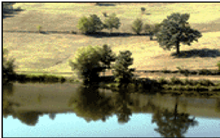
Pamje nga Gjilani

Sektorët kryesorë ekonomikë në komunën e Gjilanit deri kah gjysma e shekullit të kaluar kanë qenë bujqësia, e sidomos sektori i blegtorisë. Që nga 1957, filloi ndërtimi i kapaciteteve të fabrikave të tekstilit, duhanit, radiatorëve dhe industrisë së bukës. Industria e Gjilanit ka qenë relativisht stabile deri më 1990, kurse zhvillimin më të hovshëm e ka pasur gjatë periudhës 1957-1986, kur efektet e këtyre ndërmarrjeve janë treguar më së shumti, që rezultoi edhe në rritjen e standardit të jetesës të qytetarëve gjilanas. Gjatë dekadës së kaluarës, për shkak të okupimit, shumë nga kapacitetet industriale janë shkatërruar. Këtyre ditëve, shumica e aktiviteteve ekonomike zhvillohen në tregti.