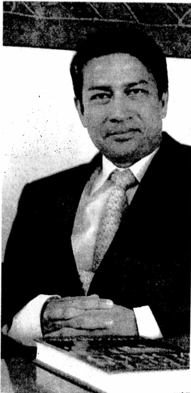
Халамжийн зарцуулалт байгаа онох нь чухал

Эдийн засгийн бодлогын үндэс үзэлт Монголд