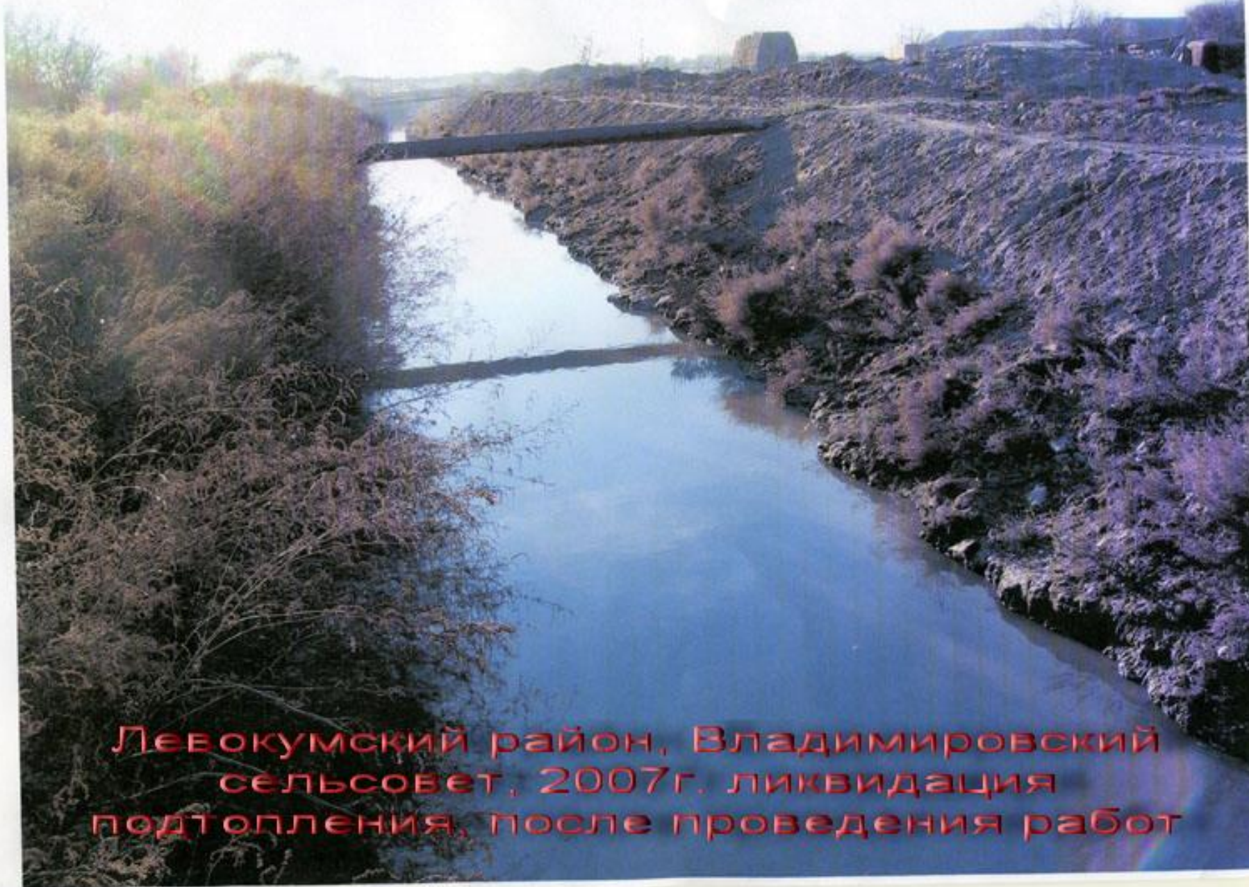
Левокумский район, Владимировский сельсовет, 2007г. ликвидация подтопления, после проведения работ