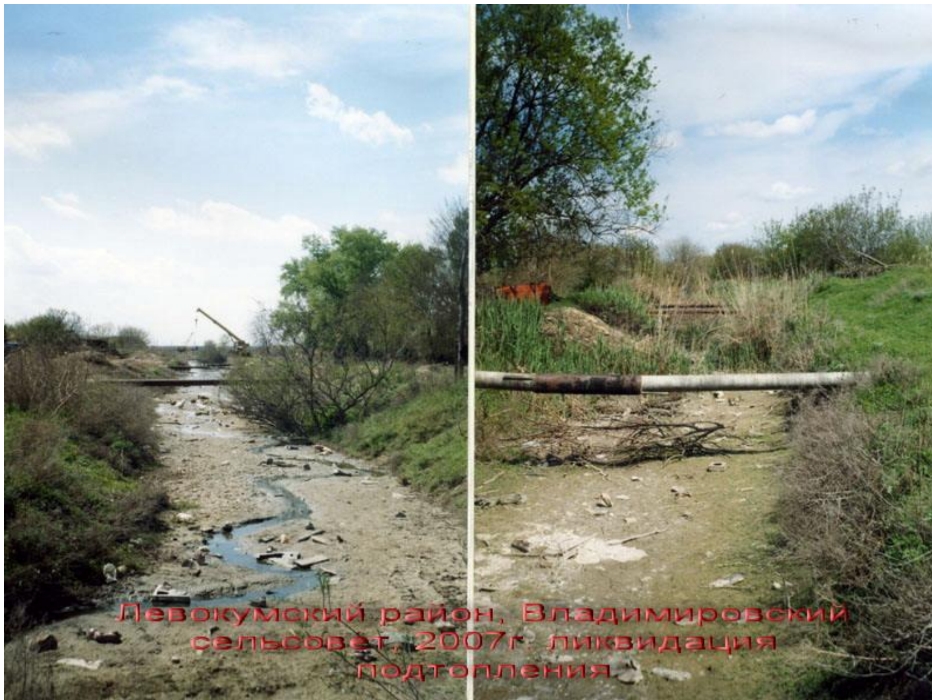
Левокумский район, Владимировский сельсовет, 2007г. ликвидация подтопления