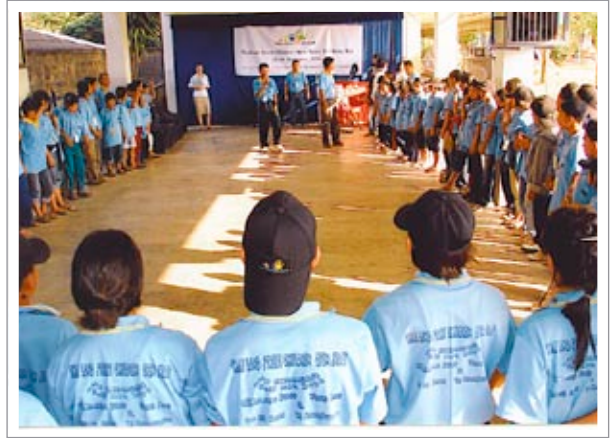
เด็กด้อยโอกาสในภาคเหนือกว่า 90 คนได้มาร่วมตัวกันที่งานประชุม “Thailand Street Children Open Space”

มาตรการหลายข้อที่สามารถนำมาใช้และทำให้เกิดผลดีได้ การลดภาระต้นทุนที่เกิดจากกฎระเบียบคือหนึ่งในมาตรการ และอาจรวมถึงการปรับราคาควบคุมของสินค้า การตีความกฎการจำกัดสิทธินักลงทุนต่างชาติ การเร่งกระบวนการทางศุลกากรให้มีความรวดเร็วยิ่งขึ้น และอื่นๆ การเจรจาต่ออายุ GSP ซึ่งกำลังจะหมดอายุกับประเทศสหรัฐอเมริกา หรือการเซ็นสัญญา FTA ระหว่างไทย – ญี่ปุ่น คือสองขั้นตอนที่สามารถช่วยให้การเติบโตของธุรกิจส่งออกมีความแข็งแกร่งและยั่งยืนมากขึ้น ในทางเดียวกัน การให้การสนับสนุนด้านปรับปรุงการศึกษาระดับมัธยมและการฝึกอบรมสำหรับหลักสูตรอาชีพจะศึกษา รวมถึงการทักษะด้านภาษาอังกฤษและไอที และการส่งเสริมให้ภาคเอกชนเข้ามามีส่วนร่วมในการให้บริการด้านการศึกษามากยิ่งขึ้นสามารถช่วยผ่อนปรนข้อจำกัดด้านทักษะซึ่งบริษัทต่างๆ ระบุว่า เป็นข้อจำกัดในการลงทุนและการเติบโตของผลผลิตได้ นอกจากนี้ การพัฒนาบริการด้านโครงสร้างพื้นฐานยังสามารถช่วยลดต้นทุนและเพิ่มอัตราผลตอบแทนให้กับการลงทุนของเอกชนได้อีกด้วย