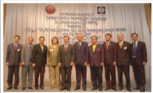
เบกพุมิเกยวสทิที่บาร่วมงานเปิดตัวโครงการ CDP-INFRA เมื่อวันที่ 31 มกราคม ที่พานมา

ถึงแม้ว่าปีใหม่จะผ่านพ้นไปไม่ถึงสองเดือนเต็มดี หลายคนก็อาจจะยังไม่ได้เริ่มทำในสิ่งที่ตนเองตั้งใจไว้ว่าจะทำในปี 2550 นี้ด้วยซ้ำ แต่สำหรับเราทุกคนที่ธนาคารโลก สำนักงานประเทศไทยนั้นเราก็ยังมุ่งมั่นสร้างสรรคงานที่เป็นประโยชน์ต่อสังคมไทยต่อไปอย่างไม่หยุดนิ่ง ดังนั้นจึงไม่น่าแปลกใจเลยที่เราจะสามารถผลักดัน โครงการความร่วมมือกับรัฐบาลไทย ถึงสองโครงการให้ออกมาในระยะเวลาไล่เลี่ยกันได้ภายในไม่กี่สัปดาห์แรกของปีหมูทองนี้