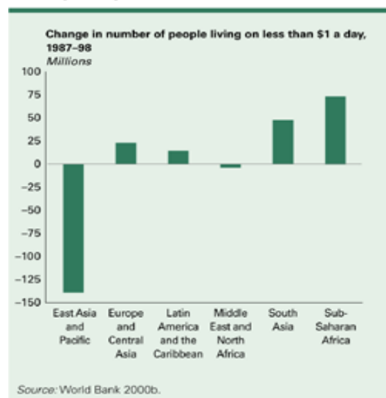
Figure 2 Where poverty has fallen, and where it has not

Il progresso nella riduzione della povertà varia enormemente da regione a regione. Nell'Est asiatico, il numero di persone che vive con meno di un dollaro al giorno è sceso da 420 milioni circa nel 1987 a circa 280 milioni nel 1998. Ma nell'Africa subsahariana, nel Sud asiatico e nell'America latina, il numero dei poveri è aumentato costantemente. Nei paesi dell'Europa dell'Est e dell'Asia centrale, in transizione verso un'economia di mercato, il numero di persone