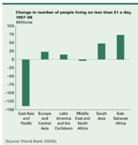
Figure 2 Where poverty has fallen, and where it has not

Для быстрого сокращения бедности усилий на национальном и местном уровнях часто бывает недостаточно. Во многих областях для улучшения перспектив бедных стран и их населения требуются международные действия, особенно со стороны промышленно развитых стран. Сюда относится уделение пристального внимания вопросам урегулирования задолженности и повышения эффективности помощи на цели развития.